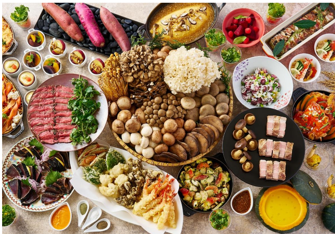
画像：『開業記念』秋の味覚ディナーバイキング 料理集合イメージ

さらに、なんと金時の蒸籠蒸しや紅はるかとクルミのロースト、紫さつまいもの冷製料理、かぼちゃのスープやサラダなど、秋の人気食材「芋」「南瓜」をつかったメニューも充実しています。