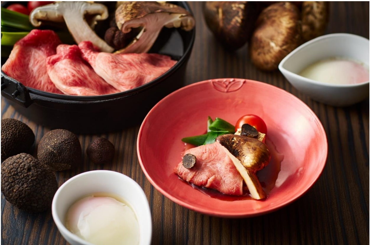
画像：近江牛のすき焼き～松茸とトリュフ風味～イメージ

今回のバイキングメニューは、秋に食べたいキノコがテーマ。松茸の他、大黒本しめじや、はなびら茸、九頭竜マイタケといった多種類のキノコが各メニューに散りばめられています。中でもおすすめは、牛肉と大黒本しめじの鉄板焼きで、目の前で焼き上げるパフォーマンスとともにお楽しみいただけます。