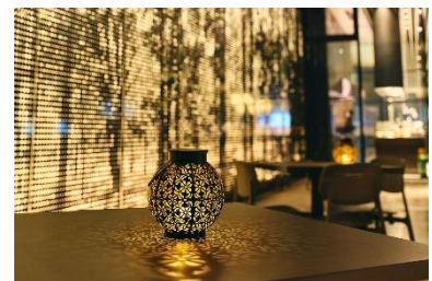
ホテルヴィスキオ大阪 今年のレストランライトダウンの様子