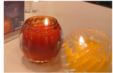
ホテルグランヴィア和歌山 今年のライトダウンの様子