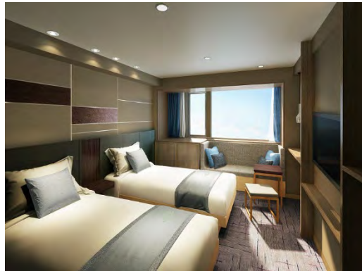
スーパーアツインルーム