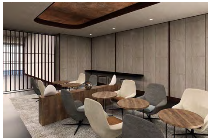
宿泊者専用ラウンジ