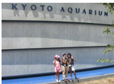
京都水族館で水の中に住む生き物たちの生態を観察しました。