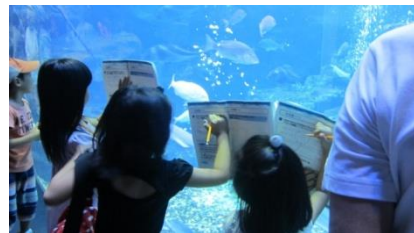
ワークブックを片手に生き物の動きや姿を観察！オットセイとアザラシの違い、わかるかな？