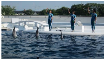
最後はイルカショーを見学して、終了！