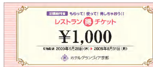
チケット券面イメージ