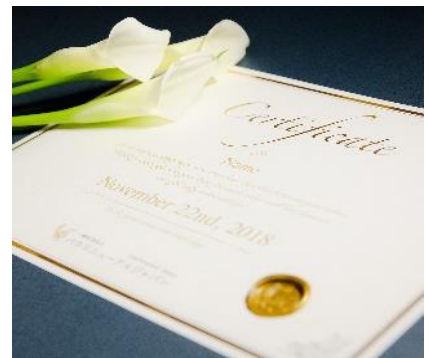
【バウリニューアルデイ証明書】

一般社団法人バウリニューアルジャパンは、日本で初めてのバウリニューアル啓発団体です。このVow Renewalという欧米の文化を継承しながら、夫婦に限らず、家族、恋人、友人など「すべての人々にとって誓いを新たにす大切な記念日がある」という新しい文化の普及活動を行っています。人々にとっての大切な記念日を「バウリニューアルデイ」＝誓いを新たにす記念日」と正式に商標登録し、「バウリニューアルデイ」を認定できる日本唯一の団体として、愛や絆、感謝を大切にす文化の啓発と普及を図っています。