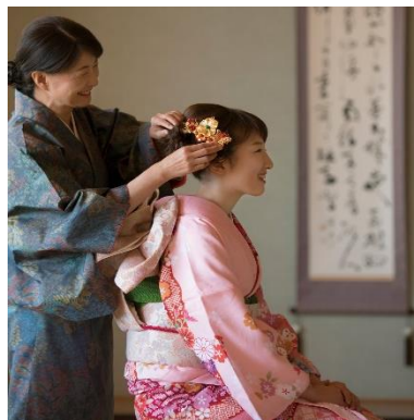
成人式を迎えるお子様へ ご両親からのお祝いに