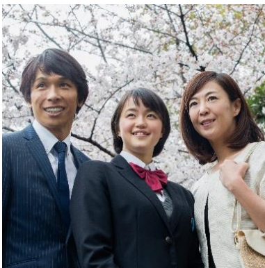
結婚式を挙げていないご夫婦が ご家族とご一緒に

このプランには、石造りのチャペル「マカリオス」でのバウリニューアルセレモニー、一般社団法人バウリニューアルジャパンの発行する世界で一つだけの「バウリニューアルデイ証明書」の贈呈、6 名様を基本とした宴会場、またはレストランでのご会食が含まれています。また、プランオプションとして、写真撮影や衣裳、宿泊の手配、思い出にちなんだ演出など、ウエディングで積み重ねてきた豊富な経験と知識で、お一人お一人にあった記念日を専属のプロポーザーが提案します。