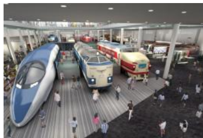
京都鉄博 1階展示ロビー

問合せ：ホテルグランヴィア京都 プライダルサロン 075-344-1111（直通）