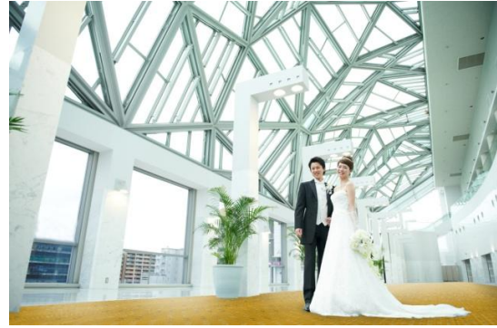
ホワイエ「クリスタルステージ」